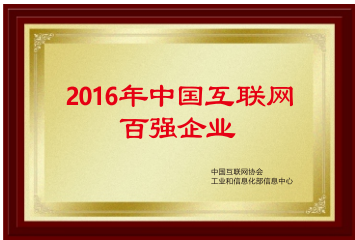
2016年7月，国技互联荣获“2016年中国互联网百强企业”称号