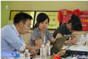
◎“两学一做”国技学习会议