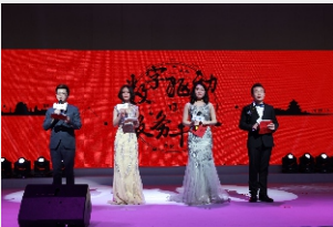
◎互联·物联·智连 数字驱动服务升级“国技互联12周年庆典暨2016年度庆典