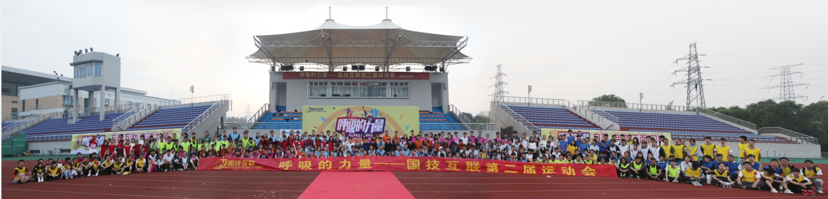
◎“呼吸的力量”国技互联第二届运动会