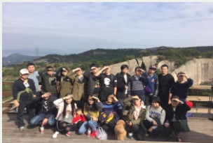
◎企业文化活动—肉松日