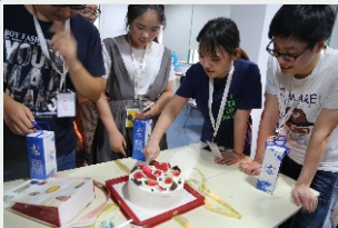
◎国技互联员工生日会