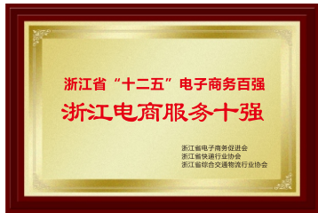
2016年9月，国技互联荣获浙江省“十二五”电子商务百强“浙江省电子商务服务十强企业”称号