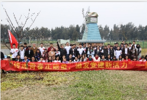
◎“传递青春正能量 激发党建新活力”2016国技植树节