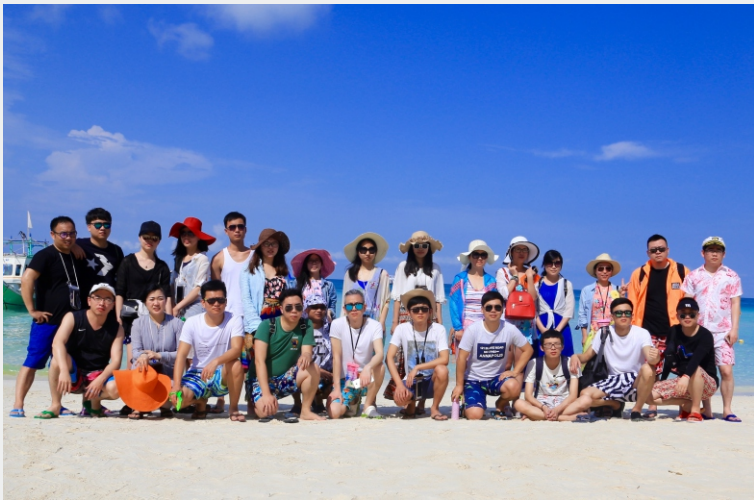
◎2016国技去旅行—长滩岛