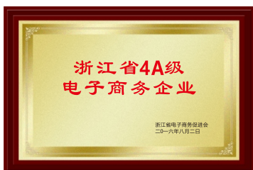
2016年8月，国技互联荣获“浙江省4A级电子商务企业”称号