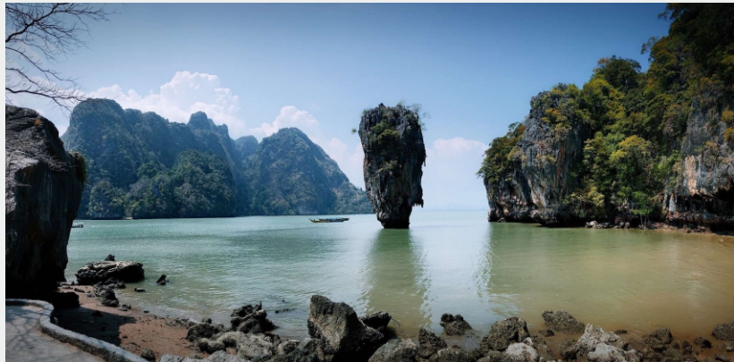
泰国普吉007岛 / 浙江国技客服部 / 苏炜宸 摄