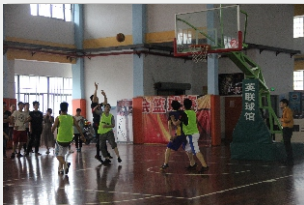
◎企业文化活动—肉松日